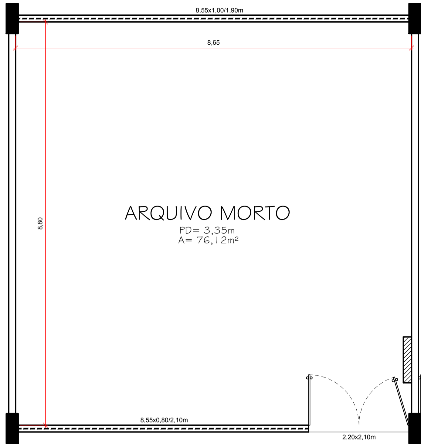
1 PLANTA BAIXA EXISTENTE - ARQ. MORTO ESCALA 1:50